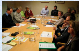
Auswertung Energiecheck - Vortrag